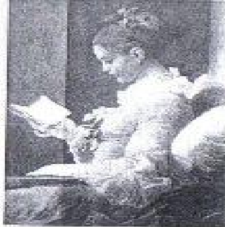
—A young woman reading. Fragonard, século XVIII.

histórico e visando a mulher como primordial para ordem do discurso, classificando-a com sondagem mantida no trabalho de investigação, integrando-a na sociedade e desconstruindo o “choque” de incompatibilidade do sexo como: homem e mulher bilateral em descasos e acaso, entre traições e fidelidades, entre punições e perdões, entre vigilância e descuidos, esses serão os primórdios mais discutido a seguir.